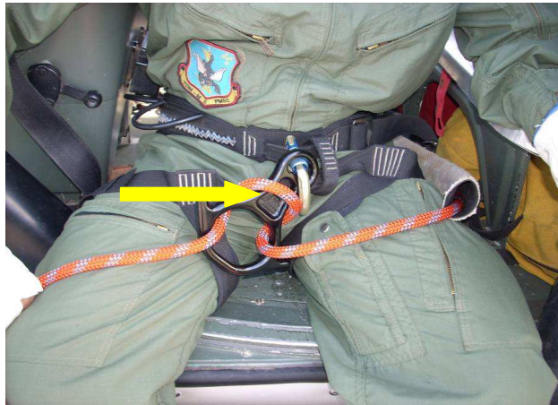
Figura nº 8 Freio em oito passou a exercer um esforço de fora para dentro

Na sequência, o rapelista se posicionou no esqui do helicóptero, iniciando a negativa, e o freio em oito continuou pressionando a capa da rosca do mosquetão.