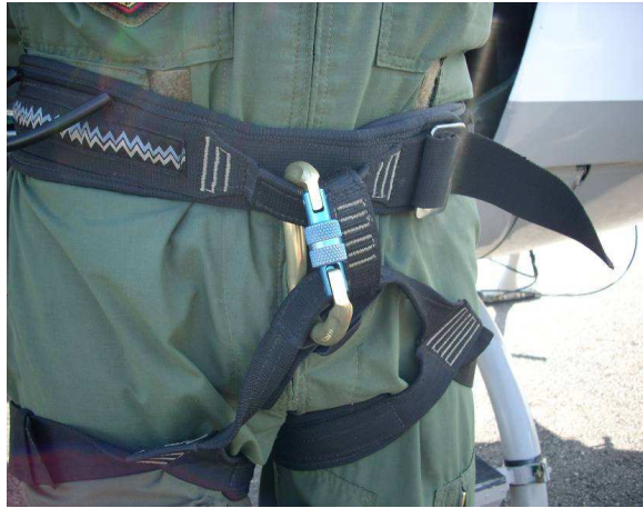
Figura nº 3 Mosquetão montado na cadeirinha de rapel

Na sequência, vamos observar os procedimentos realizados pelo rapelista acidentado: