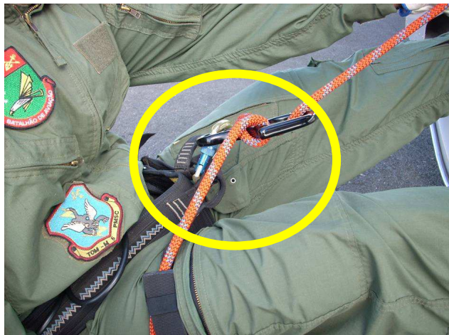
Figura nº 11 Freio em oito continua pressionando a capa da rosca do mosquetão.

Permitiu, também, que o rapelista fizesse a correção, inversão da posição do cabo de descida, sem desconectar o mosquetão e que o mosquetão e o freio em oito ficassem desalinhados. Com o rapelista próximo da posição final da negativa, observa-se que o freio em oito continua pressionando a capa da rosca do mosquetão.