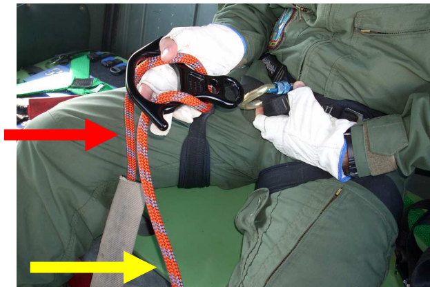
Figura nº 4 Posicionamento dos cabos

Inicialmente, ele conectou o freio em oito, peça de cor preta, ao mosquetão. Observa-se que o cabo de descida, seta amarela, foi posicionado para a lateral esquerda, enquanto o outro cabo, seta vermelha, à direita, está fixado à aeronave.