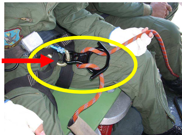
Figura nº 5 Posicionamento do cabo de descida

O cabo de descida ficou posicionado para a lateral esquerda erroneamente.