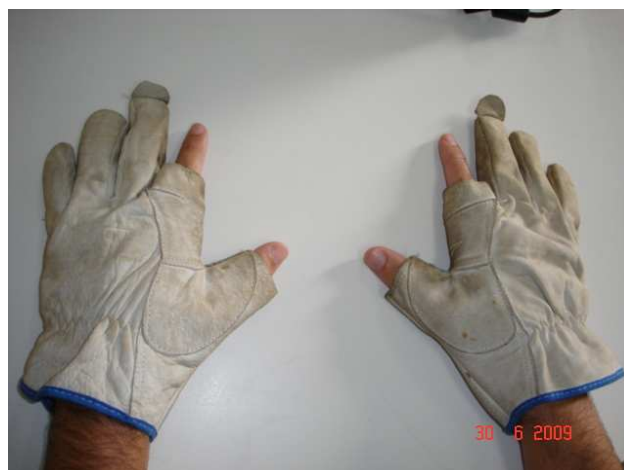
Figura nº1 Fotografia das luvas do rapelista

As luvas de couro utilizadas pelo rapelista tinham as pontas dos dedos, indicador e polegar, desprotegidas. O atrito do cabo com os dedos provocou queimaduras, fazendo com que o rapelista se soltasse do cabo pouco antes de colidir contra o terreno, causando fraturas no membro inferior esquerdo.