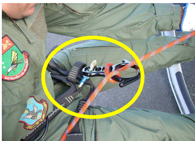
Figura nº 10 Freio em oito pressionando a capa da rosca do mosquetão

Alinhado com o esqui, observa-se o freio em oito, com o cabo tensionado devido ao peso do corpo do rapelista, pressionando a capa da rosca do mosquetão.