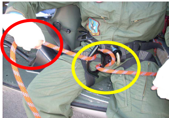
Figura nº 7 Inversão do cabo de descida

Após o procedimento incorreto, o cabo de descida passou a ser segurado pela mão direita do rapelista como mostra a foto a seguir, mas provocou um desalinhamento entre o freio em oito e o mosquetão.