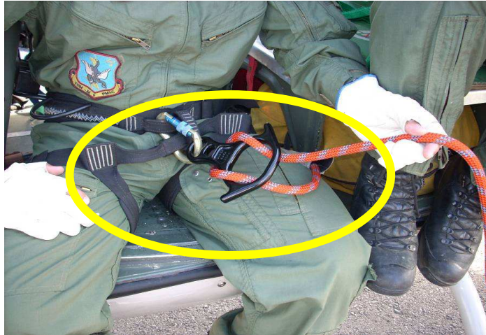
Figura nº 6 Posicionamento do cabo de descida

O rapelista posicionou-se no piso da lateral esquerda da aeronave.