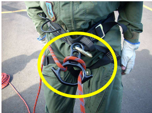
Figura nº 9 Freio em oito pressionando a capa da rosca do mosquetão

Na sequência, o rapelista se posicionou no esqui do helicóptero, iniciando a negativa, e o freio em oito continuou pressionando a capa da rosca do mosquetão.