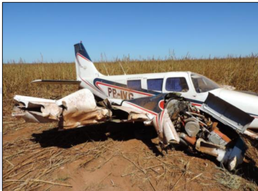
Figura 3 - Detalhe dos danos à asa e ao motor direito da aeronave.

Nesse contexto, é possível que tenha ocorrido uma inadequada avaliação dos fatores que comprometeram o desempenho da aeronave, levando o piloto a, equivocadamente, atribuir o problema a uma falha do motor direito.