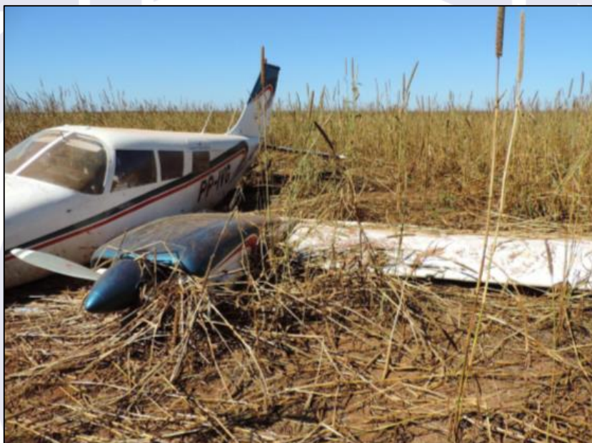
Figura 1 - Aeronave após a ocorrência.

A aeronave teve danos substanciais. O tripulante e o passageiro saíram ilesos.